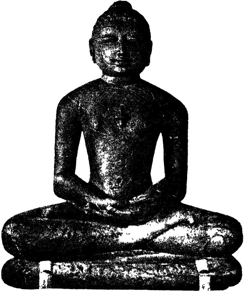
तीर्थङ्कर वर्द्धमान-महावीर जिनकी निर्वाण-रजतशती राष्ट्र मना रहा है ।